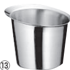
⑬18-8 ニューワインクーラー S No.10010