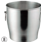
⑧SUS 18-8 ワインクーラー