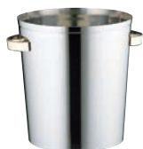
⑪18-0 ワインクーラー ビバ AM530