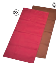
ロングトーション