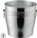
⑨SUS 18-8 ワインクーラー 受皿