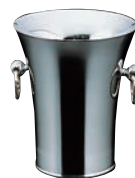
③18-8 パーティークーラー A型