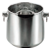
⑤18-8 SRグランデー シャンパンクーラー