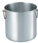
⑫18-8 ワインクーラー パブ MR-459