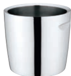
①UK 18-8 シャンパンクーラー ダブルウォール