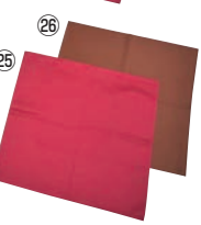
ショートトーション