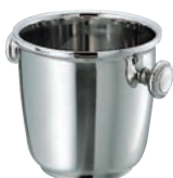
②SW 18-8 二重 シャンパンクーラー