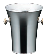
④18-8 パーティークーラー B型