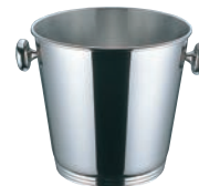
⑩18-10 シャンパンクーラー 42448 (ミラー仕上)