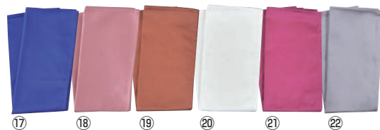
カラートーション