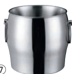
⑦18-8 二重ワインクーラー DW-2 (ミラー仕上)