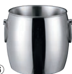
⑥18-8 二重ワインクーラー DW-1 (ミラー仕上)